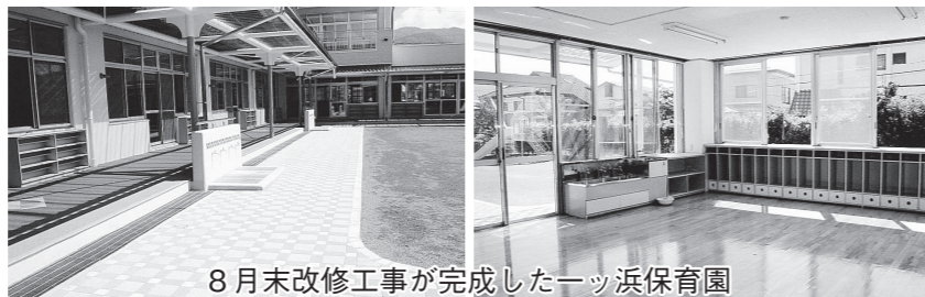
8月末改修工事が完成した一ツ浜保育園