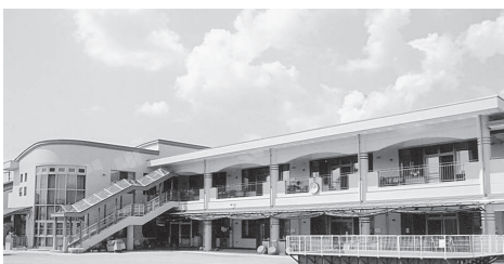
第二保育園 (21年4月開園)

また、廃園後の第三保育園を活用する「高齢者と子育てふれあい交流センター（仮称）」の開設に向けて、広く町民の皆さまのご意見をいただきながら、施設改修と具体的な事業の内容について検討しております。未来を担う子どもたちの保育環境の充実に皆さまのご理解とご協力をお願いします。