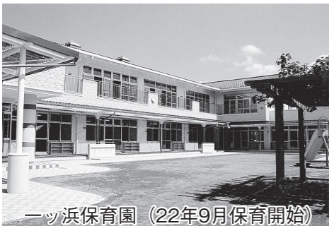
一ツ浜保育園 (22年9月保育開始)