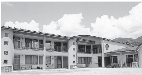
第五保育園 (22年4月開園)