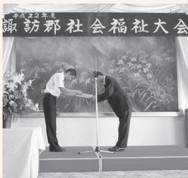
日本電産サンキョー労働組合 下諏訪支部 様