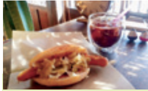
当店オリジナル「なかサンド」580円