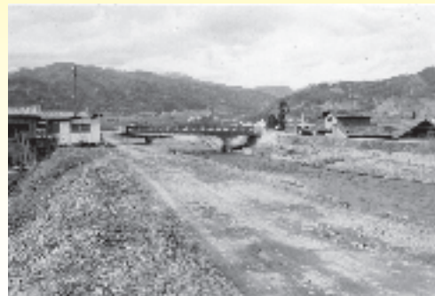
鷹野橋付近