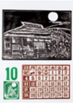
10月の暦 お月見 松倉 秀男作

「昔の下諏訪町ってどんな風景だったんだろう?」と思ったことはありませんか？今年度は、貴重な昔の写真と現在の写真を並べて、下諏訪町がどのように変わってきたのかお伝えしていきます。