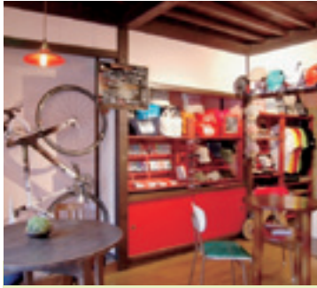
自転車柄の生活雑貨「lovell」の全商品を取り扱っています♪

毎月発行しているクローズアップしもすわで、町内の企業を紹介します。内容は各会社から提出いただいた原稿を基に掲載しています。掲載を希望する企業は下諏訪町 総務課 情報防災係（電話27-1111 内線262）までご連絡ください。