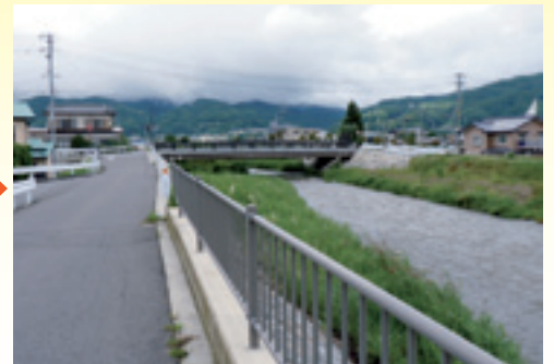
同じ位置から撮影した現在の写真です。