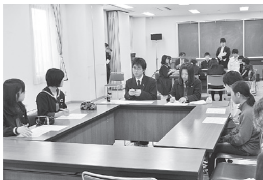
プロジェクトグループBで司会をする

学生と一緒に全力でやっていきたいと思っています。 現段階では、花の生長はどの種も順調に育っています。これから先に行う植えかえが楽しみです。 計画はまだ決まっていない部分があり、それを詰めていくのが大変ですが、毎日がとても充実していて、この計画に参加でき、本当に楽しいです。計画が達成するまであと数ヶ月しかないのです。良い結果が出るように力を尽くします。