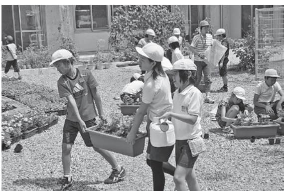
休み時間の植え替え 7/17

男女問わず、楽しんでやってくれるのは、とってもうれしいな」と思いました。委員会の企画にも全校のみんなが積極的に取り組んでくれて、すごく嬉しかったです。苦労してやったかいがあったと思います。このプロジェクトは始まったばかりだけど、今よりもっと下諏訪町に花が増えるように、まずは学校の中から花を増やしていくって、学校の外にだんだんと広めていきたいです。