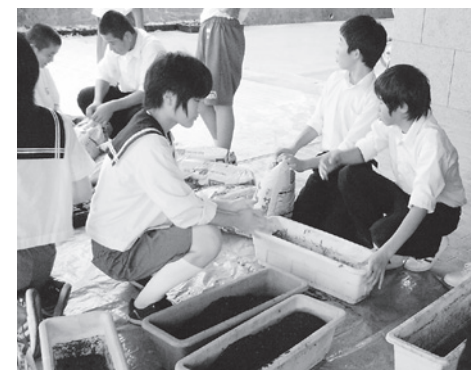
プランターに苗を移植する 7/16

は町内の小中学校や下諏訪向陽高校、花田養護学校の代表者や地域の方々、アドバイザーの方、まとめて話し合っています。私はその全体会議を通して、様々なことを学び感じました。全体会議が終わった後、いつも感じることは、地域との絆が深いということです。このしもすわガーデンプロジェクトは、地域の方々力なしではどうにもなりません。設置場所やこの水やり、花の管理なども配