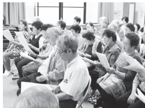
それぞれの想いを込めて歌う

毎回二区分館報でお知らせしていたのですが、事前に参加希望を募っていないため、「今回は、何人集まってもえらるか」と非常に不安です。お陰様で、初回以来この八月開催で、五年目通算十八回目を迎え、参加者も毎回三十から四十人を数