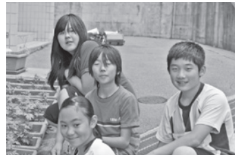
育てた苗の前で委員の皆さん

私は、ガーデンプロジェクトの活動をする中で、観光客や町の方々に喜んでもらえるようにしたいです。