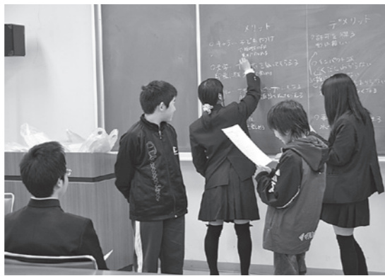
黒板に出された意見を整理する

ねる方だけでなく、陰ながら応援していただく多くのの方々によって支えられ、つくられているのだと実感します。