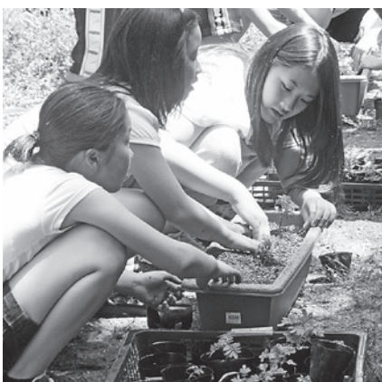
プランターに苗を植える 7/19

芽が思うようにならずに苦労しましたが、目標の数には達したので安心しました。これから水やりをして、きれいな花が咲くように見守りたいです。自分たちの花が育っていくのを見ると、とても楽しくうれし