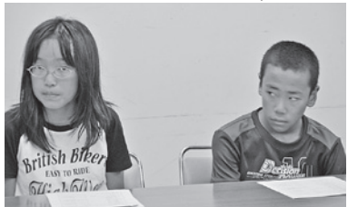
プロジェクトで真剣に話し合う

私はこのプロジェクトに参加して、花に興味をもつことが多くなりました。この町内が花でいっぱいになり、きれいになつてほしいと思いました。花がない所に一つでも花を置けば、だんだんと明るくなっていくと思います。