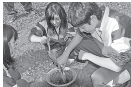
マリーゴールドの種をまく 5/8