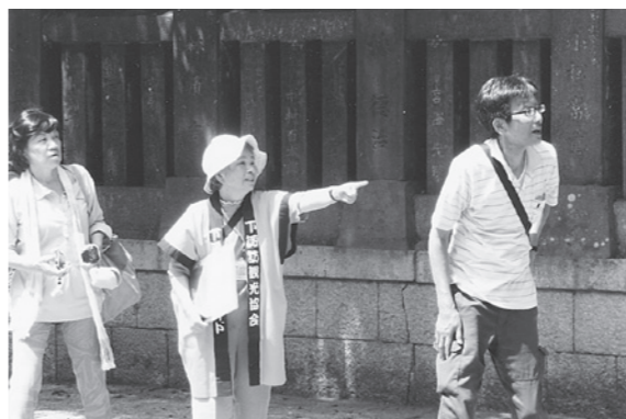
春宮をガイドする

あの太宰府のご婦人が、私のガイドの原点です。私たち観光ガイドの「心のおもてなし」が、町の観光に、まちづくりに、そ