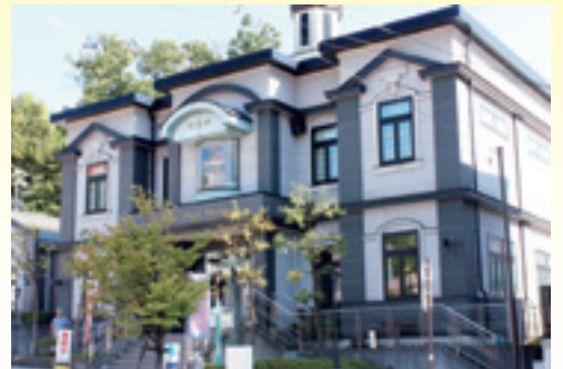
同じ位置から撮影した現在の写真です。