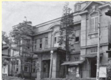
【旧町役場(現在の奏鳴館)】