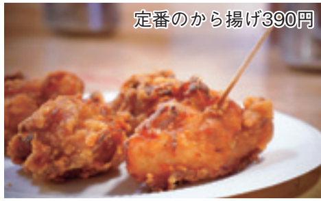
定番のから揚げ390円

銘柄鶏である信州ハーフ鶏を使った、カリッとジューシーなから揚げのテイクアウト専門店です。地域の皆様に愛して頂き、おかげさまで3年目になります。モモ肉・ムネ肉、醤油味・塩味のスタンダードな種類の他に、ゆず塩味や期間限定商品、お弁当や丼などもご用意しております。お弁当のご予約や配達も承りますので、お気軽にお問合せ下さい。9月よりソフトアイス（260円）を始めました♪から揚げをお買い上げの待ち時間に、ぜひどうぞ(^^) ☆毎月16日は真心（まごころ）デー 全品20円引・4の付く日はポイント2倍!!