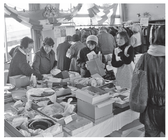
昨年のバザーの様子

〈歳末ささえあいバザー〉 実施日：平成25年12月10日(火)～12日(木) 実施場所：下諏訪町老人福祉センター