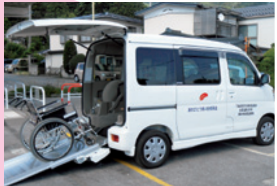
車種：ダイハツ アトレーワゴン (4WD AT)