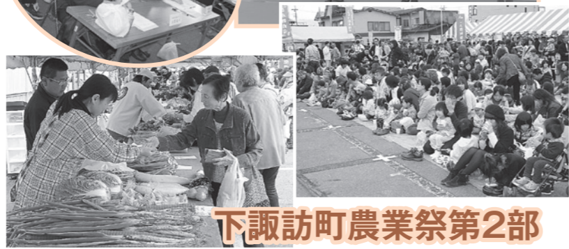
下諏訪町農業祭第2部