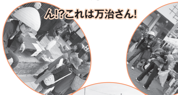
ん!?これは万治さん!