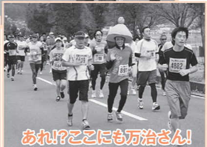
あれ!?ここにも万治さん!