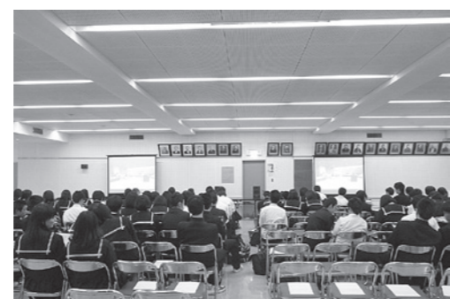
昨年のバザーの様子