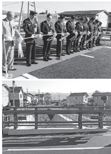
両市町を結ぶ橋の名前を公募し、地名の「長地御所」と「社東町」から『御所社橋』と命名されました。