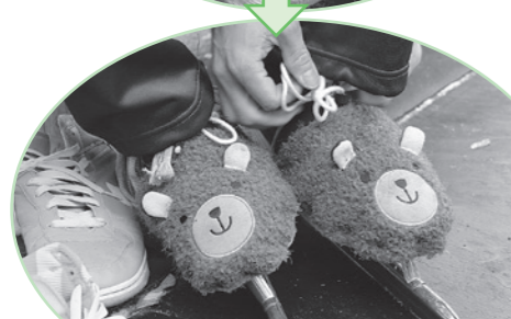
21世紀版げたスケート