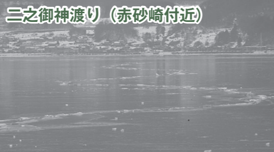
三之御神渡り (赤砂崎付近)