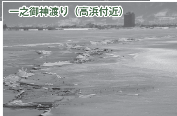
一之御神渡り (高浜付近)