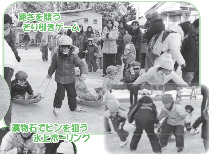
速さを競う ぞり引きゲーム