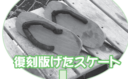
復刻版げたスケート