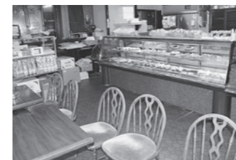
喫茶スペースのある落ち着いた店内

これからも地域に根ざした新商品の開発はもちろんの事、お子様からお年寄りまで誰もが喜んでもらえるようなお菓子を作っていきたいと思っております。