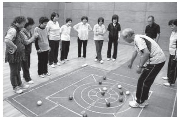
楽しく体を動かそう