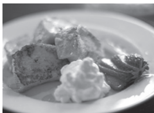
大好評のフレンチトースト

1F「fermata」では、自家焙煎専門店から取り寄せた豆で淹れる、香り豊かな挽きたてのコーヒーをお楽しみいただけます。その他、紅茶やハーブティー、自家製ドリンクもご用意。昨年春から始めたフレンチトーストは大好評をいただき、手作りスコーンやケーキも人気。