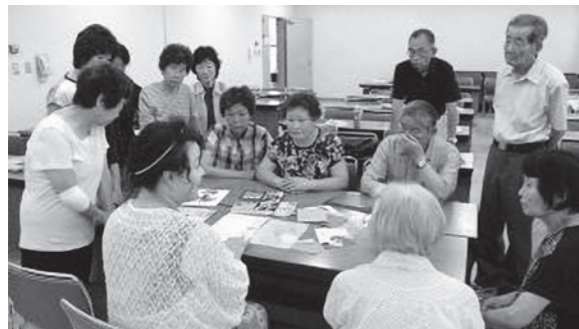
手作りいきいき工作教室

「ともに学び、善く生きる」のもとに、16名の受講生が和気あいあいと、工作、英会話、セラバンド、切り絵、健康体操、文学講座等に集中し、充実した時を過ごしました。