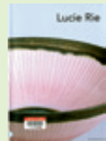
エマニュエル・クーバー/著

白いエプロン、白い服、白いスニーカーで作品を作り続けた陶芸家ルーシー・リー。彼女の作品は、シンプルで控えめな北欧モダンイズムの影響が色濃く、滑らかな陶肌や小さな斑点が滲み出た表面がアクセントを添え、流れるような形状を際立たせています。鉢やティーポット、平皿等を手がけ、ろくろの挽ぎで成形した後ろくろの上で削りを施し、見事な作品を仕上げられています。「作品は、その人そのものである。」と言われるように、静かで美しい彼女の作品が掲載されたこの本は、陶芸家だけでなく是非読んで頂きたい一冊です。 (島田 博子)