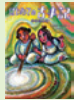
竹中 淑子 根岸 貴子/文

子どものための古事記の本はたくさんありますが、この本は小さい子どもにもわかりやすく、親しみやすくつくられた本です。お話のおもしろさを活かし、読み聞かせにも使えるよう語り直した古事記入門にふさわしい本です。 諏訪大社のタケミナカタノカミ(建御名方神)が登場する「国ゆずり」の話や「いなばのしろうさぎ」などの神話が、下諏訪図書館で昨年ワークショップを行ったスズキコージさんの挿絵で楽しめます。 (演 智栄子)