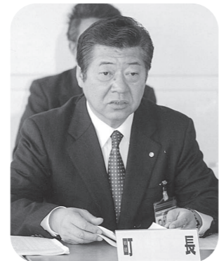
下諏訪町長 青木 悟

設置し、観光協会と連携した活動を展開し、街なみ環境整備事業など歴史や景観を活かした事業を更に推進し、産業振興とまちづくりを一体的に捉えて町の活性化を図ってまいります。 教育関係では、北小・下中・中の耐震化事業も前年度無事終了し、本年度から南小学校の改築事業に向けた実施設計を行い、安全で快適な学習環境の整備に努めてまいります。 本年度は、第六次総合計画の後期五カ年計画、第四次行政改革大綱、それに伴う新たな行政経営プランがスタートする年でもあり、今後とも「改革の意識」を持ちつつ、中長期的視野に立った「計画投資」を行い、住民の皆様とともに将来に夢を描ける「まちづくり」を進めてまいります。