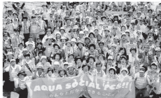
AQUA SOCIAL FES! 2012年 副知事・町長とともに

諏訪湖のヒシと婦人会のそも そのきつかけは、平成二十年 に町連合婦人会が諏訪湖漁業組 合に講演をお願いしたことに始 まります。当時はヒシの繁茂が 目立ち始めた頃であり、この講 演をきっかけに婦人会の事業と して始められました。危険とい われかなりの批判の中で、漁協 さんの後押しでの実現でした。 ヒシといえば銀行のマークか 忍者の投げる物：それが湖の底 にしっかりと根付いているとは 全く知らなかったこと。舟に乗 り水に浮いてその下三メートル