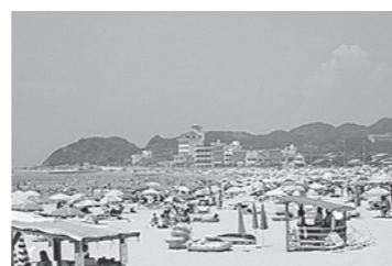
太平洋 南知多町海水浴場