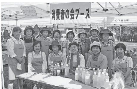
8月・諏訪湖クリーンまつり

今、消費者の会では、ゴミ減 量・石油削減・CO 2 減量を目指 し、レジ袋削減・マイバック持 参運動を行い、持参率80%を目 標に店頭啓発を行っています。 仲間になって一緒に活動しませ んか。お待ちしております。