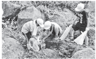
こんな所にもゴミが

「あつた。」 「やった。」 「きたない。」 「北の子」(総合的な学習の名称)の授業で、砥川や学校周辺のゴミ拾いをしました。目的は、観光に来た人たちに、いい気持ちで観光をしてもらいたいということです。