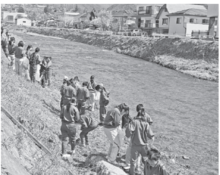
きれいな砥川にしたい

諏訪湖をもっときれいに。砥川をもっときれいに。これは誰もが思うことでしょう。そんな思いだけでなく、小さな私たちの行動から少しずつきれいな諏訪湖を取り戻していきたいです。(現在 卒業)