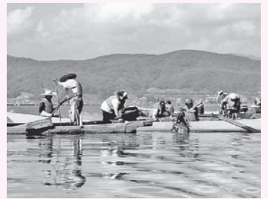
ヒシ取りプロジェクト

〒393-8501 長野県諏訪郡下諏訪町4611-40 (下諏訪総合文化センター内) ☎ 0266-27-1111(内線718) FAX 0266-28-0131 E-mail=syougai@town. shimosuwa.lg.jp