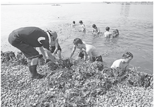
諏訪湖に入って根っこから

男子が実際に諏訪湖へ入り、ヒシを根っこから引き抜き、それを女子が岸にあげる……。これを何度も繰り返します。暑くて本当に大変な作業ですが、一、二年生で協力して頑張つてやっています。そして作業終了。たくさんさんのヒシが取り除かれ