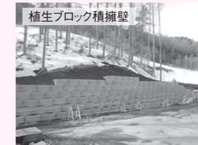
植生ブロック積擁壁

3月15日に行われた第1回工事現場見学会に引き続き、第2回目の見学会を開催します。当日は、工事の現場状況説明や見学に加え、解体工事や造成工事で使用されている建設機械の試乗等を予定していますので、園児や小学生のお子様も含め、多くの皆さまのご参加をお待ちしております。