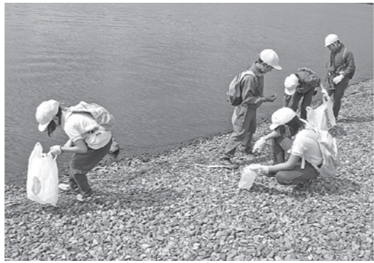
きれいな諏訪湖にしたい

今の諏訪湖も、人間が汚してしまったことで、住めなくなつた生き物があると聞いたことがあります。だから昔の諏訪湖に戻って来てくれるように、毎日の生活の中で、自分たちのできることをしていくことが大切だと私は思います。(現在五年)