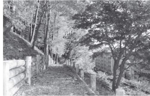
整備後の鎌倉街道