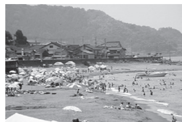
日本海 藤崎海水浴場