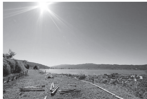
ビューポイントからの眺望

～「信州ふるさとの見える丘」について～ 「信州ふるさとの見える丘」とは、「信州らしさ」や「ふるさと」を感じ、広がりのある風景を展望できるビューポイントを県内外の方にPRし、訪れていただくために長野県が認定しているものです。 現在県内で15ヶ所（諏訪地域は2ヶ所）が認定されています。