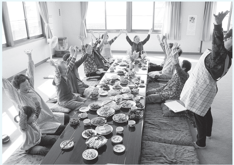
高木温泉ふれあい・いきいきサロン

「社協会費」は、昭和51年に下諏訪町社会福祉協議会が、任意の社会福祉団体から、区町会や地域の様々な機関、団体の推薦を受け、全住民参加型の福祉の促進を目的に、社会福祉法人化した時に、全世帯に会員として趣旨へのご賛同をお願いをしてきた経過がございます。 又、平成7年度の地域懇談会を経て、現在の金額とさせていただきます。