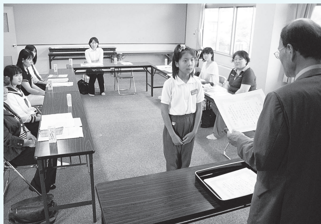
平成22年度 社会福祉普及校連絡会議