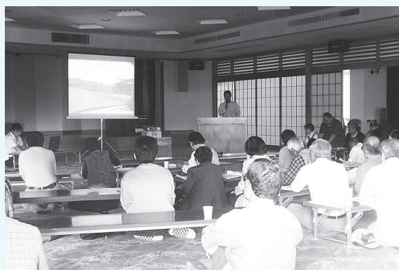
東日本大震災 災害ボランティア活動報告会 (主催：下諏訪町災害ボランティア連絡会)

下諏訪町災害ボランティア連絡会、各地区災害ボランティアの会、下諏訪町ボランティア連絡協議会と連携して、災害救援ボランティアセンター設置訓練や研修会などで、災害ボランティアの育成を行い、もしもの時の災害に備えています。