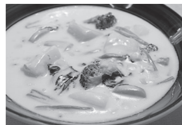
野菜クリームシチュー

もちろん素材にこだわったクリームシチューは今でも変わらず昔の味を守っています。野菜たっぷりのクリームシチューのほかに、ビーフシチューやシーフードシチューなどもご用意しておりますので、ホッと一息つきたいときや、お友達同士やご家族でゆっくりとお食事を楽しみたい方は是非アロンジーにお越しください。またアロンジーには駐車場がございません。下諏訪町をぶらり散策し、お腹がすいたら駅前にある洋食屋さんはいかがですか？家庭では味わえないプロの技をじっくり楽しんでいただくため、どれを選んでも間違いのないスパゲッティと、野菜やお肉の旨味を引き出したマイルドでやさしいテイストのシチューをご用意しております。