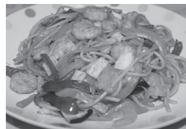
エビ入ナポリタン