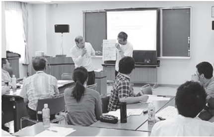
配慮された避難所のあり方について発表