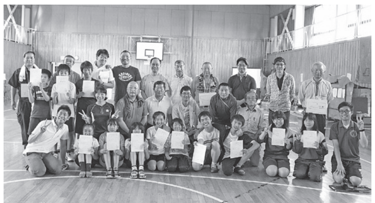
ジュニア防災リーダー研修に参加されたみなさん

今後も定期的にジュニア世代を対象とした防災研修を実施したいと考えておりますので、多くの児童生徒の皆さんの参加をお願いいたします。