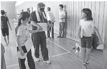
要支援者（目の不自由な方）を案内