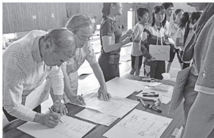
避難所におけるルールを検討