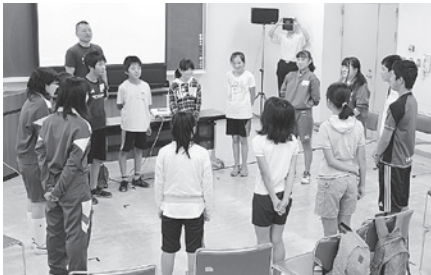
ジュニア防災リーダー研修スタート