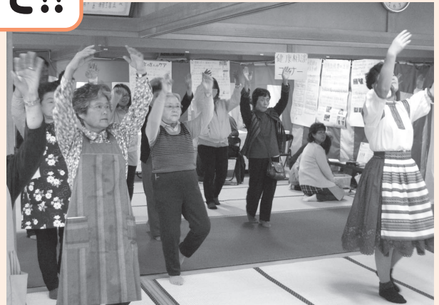
子どもから高齢者まで、みんなで楽しく!!

今年は9回目になり、これまでに延べ200人以上の方が実行委員経験者として、「地域の福祉力」の向上につながっています。