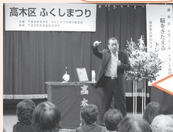
講演：「脳をきたえるトレーニング」 講師：諏訪東京理科大学 篠原 菊紀 教授