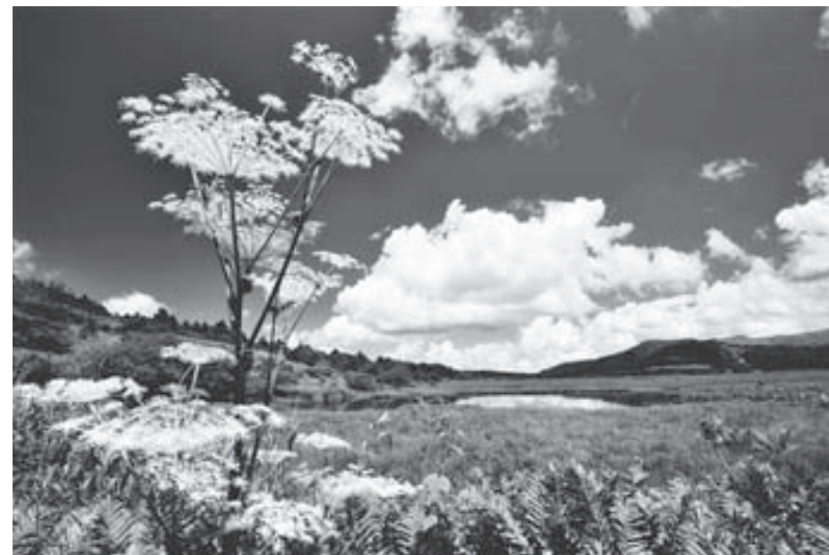
最優秀賞 『八島湿原の夏』

平成26年7月1日～平成27年1月31日の間“自然”“歴史”“お祭り”の3テーマで募集し、400枚を超える写真が集まりました。厳正なる審査の結果、下記の作品が入賞しました。