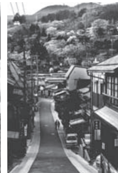
町民賞(歴史部門) 『夕暮れ時』