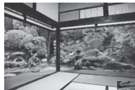
優秀賞(歴史部門) 『憩いの一刻』