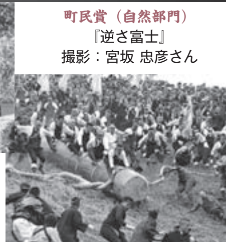
町民賞(お祭り部門) 『命をかける瞬間(とき)』