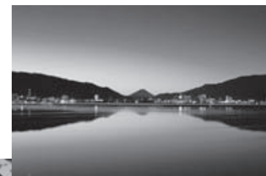
町民賞(自然部門) 『逆さ富士』