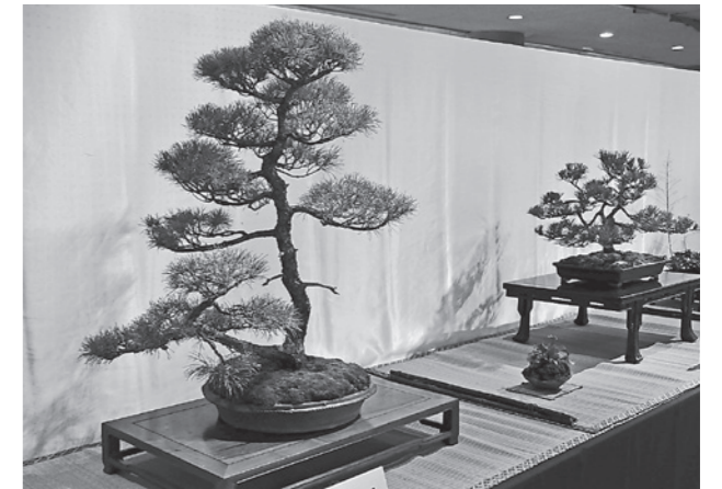
樹草会（盆栽・山野草）