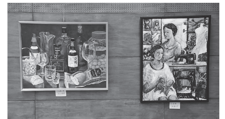
下諏訪美術会（日本画・洋画・陶芸）