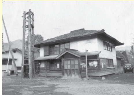
【旧明新館】町博物館所蔵