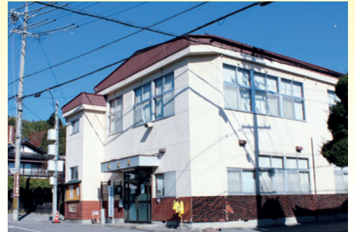
同じ位置から撮影した現在の写真です。