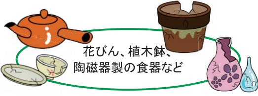
花びん、植木鉢、陶磁器製の食器など