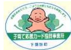
▲協賛事業所「ステッカー」