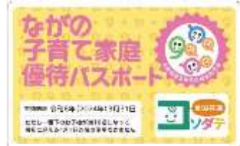
▲ながの子育て家庭優待パスポート

下諏訪町教育委員会 教育こども課 子育て支援係 TEL 27-1111 内線 714