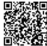
▲【協賛店舗検索サイト】 http://pass.nagano-kosodate.net/ksearch/