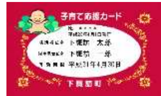
▲子育て応援カード

【問い合わせ先】 下諏訪町教育委員会 教育こども課 子育て支援係 TEL 27-1111 内線 714