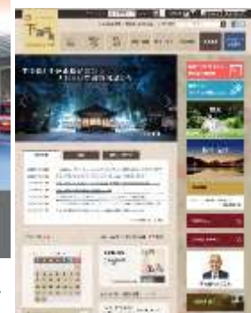
▲町広報誌 クローズアップしもすわ