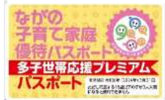
▲多子世帯応援プレミアムパスポート