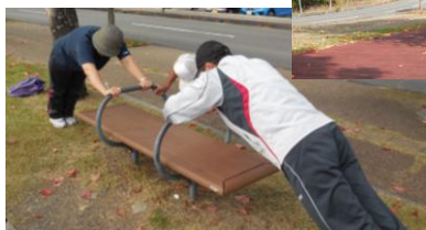
【みずべ フィットネス】