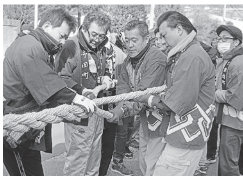
みんなで力を合わせて

さて、綱打ち当日の二月二十八日は快晴となり、午前六時に各係が神事の場所である信金御田町支店前の駐車場集まりました。武藤工業前の町道には、荒縄百三十五玉が積み上げられ、トラックには綱打ち機械がセッ トされました。 午前八時に神事も終わり、木遣り一声、綱打ちが始まりました。