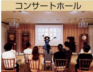
コンサートホール