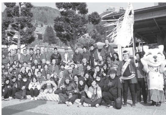
ミータマちゃんも一緒に

諏訪人の心の節目に七年という単位があり、『次の御柱祭までになにかをしよう』『私は後何回の御柱祭を見られるだろうか』と言われます。地域に密着した御柱祭には、地域を結びつける力があります。その前奏曲が綱打ちです。さあ御柱祭はがんばるぞ！楽しみだ！