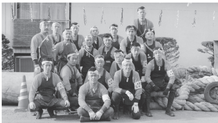
地区の仲間たちとともに

こともしばしばで、氏子にも顧客にも大いに楽しんでもらう為に的確な仕事をなす。これには知識と心の準備は怠れない。まだ祭りも半ば、心身共に熱して鍛え込み、次の里曳きを迎えたい。