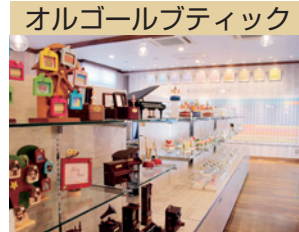
オルゴールブティック