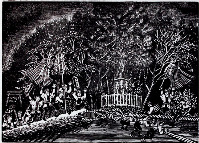
7月画題 里曳き 柴田吉郎作