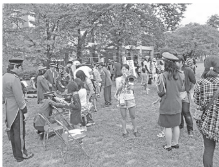
ふれあい音楽ひろば