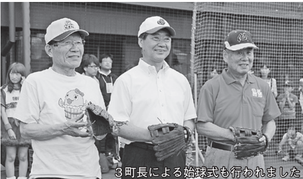
3町長による始球式も行われました

BCリーグ「信濃グランセローズ」vs「福井ミラクルエレファッツ」の試合が諏訪市諏訪湖スタジアムで行われました。