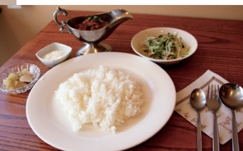
おすすめの「ドライキーマカレーセット」(サラダ、飲み物付き) 1,000円

1階はテーブル、カウンター合わせて15席のカフェで、下諏訪のおいしい水で抽出する水出しコーヒーに、9種類のスパイスで作るキーマカレー、自家製天然酵母のパンなどのメニューを用意しています。