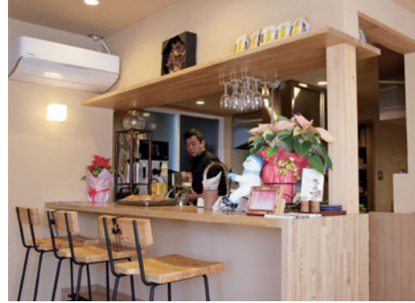
木の温もりを感じるあたたかい店内

クローズアップしおすすめでは毎月、町内の企業を紹介しています。内容は各企業から提出いただいた原稿を基に掲載しています。掲載を希望する企業は下諏訪町 総務課 情報防災係（電話27-1111 内線262）までご連絡ください。