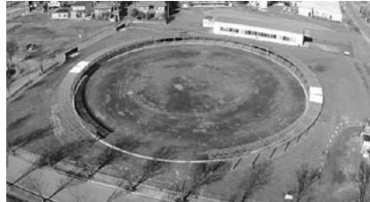
上空からみたパーゴラ