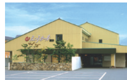
えこホール諏訪 諏訪市中洲5723-8