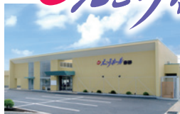
えこホール赤砂 下諏訪町東赤砂4692-1