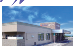
えこホールみずべ 下諏訪町東赤砂4694-4