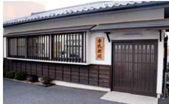
事務所は景観に配慮した色を基調にしています

下諏訪町のほか、諏訪地方を中心に上伊那のニュースも載せていますので、近隣の情報も知ることができます。下諏訪支社は、大社通り沿いにあります。ぜひ身近な温かい情報をお寄せください。