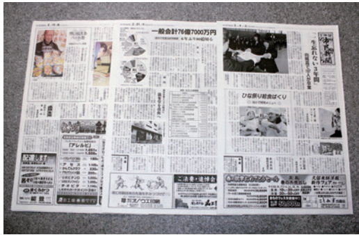
地域話題を紙面で紹介しています

クローズアップしおすすめでは毎月、町内の企業を紹介しています。内容は各企業から提出いただいた原稿を基に掲載しています。掲載を希望する企業は下諏訪町 総務課 情報防災係（電話27-1111 内線262）までご連絡ください。