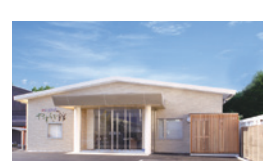
えこホール諏訪やすらぎ館 諏訪市中洲5343-7