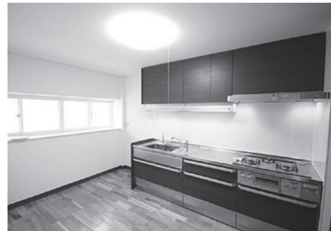
キッチンのリフォーム