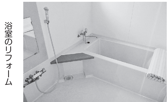
浴室のリフォーム