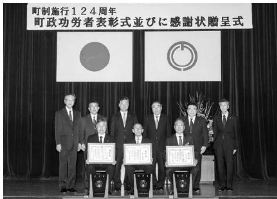
町制施行124周年 町政功労者表彰式並びに感謝状贈呈式

多年にわたり、やまびこの会 で録音図書の貸出しなどのポ ランテニア活動を行い、町の 公益に寄与されました。