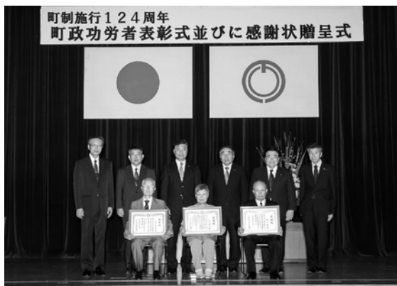
町制施行124周年 町政功労者表彰式並びに感謝状贈呈式

商工会議所の議員や副会頭を 歴任、会頭として平成22年か ら6年間、町の産業発展にご 尽力され、町政の発展に貢献 されました。