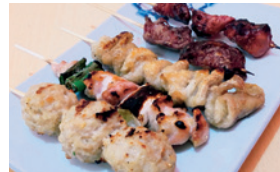
▲自慢の炭火やきとり 「おまかせ5種」（かわ・レバー・ねぎま・砂肝・つくね）

駅を出てすぐのところに8月にオープンした「やきとりとり志」。店内は14席とこじんまりとした、昭和レトロな雰囲気漂う昔ながらの赤ちょうちんのお店です。店の名前に掲げているとおり、やきとりが売りで、安くて美味しい「本格炭火やきとり」を30種類以上そろえています。お酒の種類も多数ご用意しみなさまをお待ちしておりますので、是非お立ち寄りください！