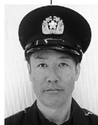
網野第三分団長 (第三区)