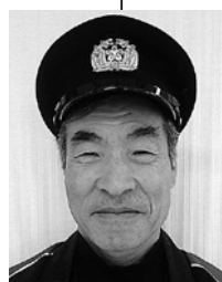
三井第二分団長 (第二区)