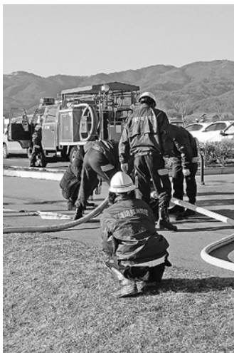
春の非常招集訓練

これからは一地域住民として、下諏訪町消防団を応援いたす所存です。今後の皆さんの活躍を期待します。