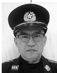
大久保第一分団長 (第一区)