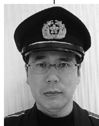
宮坂第五分団長 (第五区)