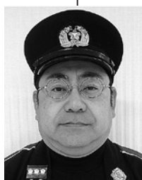
宮崎第四分団長 (第四、十区)