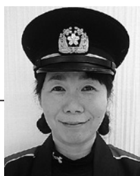
両角女性消防隊長