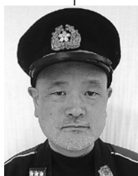
大和第七分団長 (第七、八、九区)