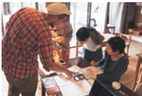
スメバで地域情報交換