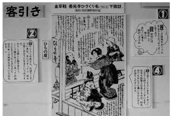
滑稽本で有名な十返舎一九が下ノ諏訪宿での客引きの様子を面白おかしく書いている。

まず、下ノ諏訪宿は「名にしおう下の諏方」と書かれていて（木曾路名所図会）、とても有名だったことがわかります。日常的に遊女らによる客引きが盛んに行われ、宣伝チラシやガイドブックへ広告を載せるなどして客を寄せ、かなり賑わった宿屋もあったようです。一方で、ストイックな商人等のため