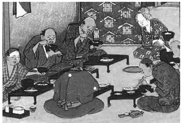
木曾海道六拾九次之内下諏訪（一粒斎広重画）の夕食風景（部分拡大）