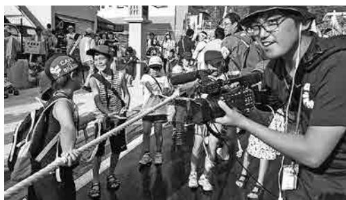
とても暑い日でしたが、小綱を持って、みんな笑顔でお舟を曳きました