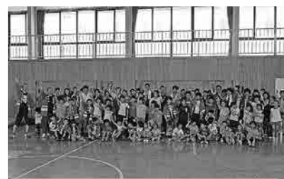
たくさんの方に参加して いただきました