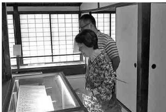
江戸時代の献立の展示を熱心に見てくださるお客様

今、お客様が下諏訪を訪れ、人や歴史的な家並に触れた時、江戸時代から続く、無形文化財ともいえる何かを感じ、冒頭の感想になったのでは？ と思います。