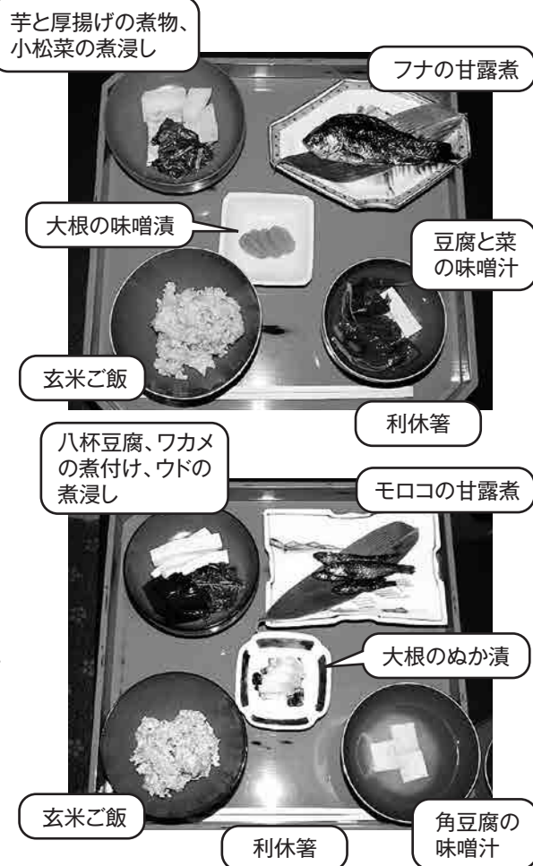
まるや旅館さんに1813年4月22日(旧暦)の夕食(上)と23日の朝食(下)を実際に作っていただいた。

先日、機会に恵まれ、まるや旅館さんに資料館で展示している夕食と朝食の献立を作っていただきました。江戸時代から伝わる膳や椀や皿に装われた料理は、見た目も味も上品そのもので、利休箸や笹の葉がさりげなく置かれており、本物の“おもてなし”を感じました。そして、この“おもてなし”が江戸時代からずっと受け継がれてきたんだな、と思いました。