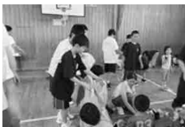
中学生も参加 効率アップ！