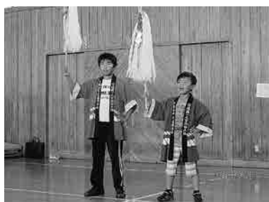
子ども きや 木遣り 協力一致でおねがいだ