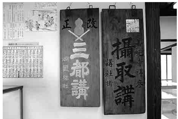
講札：今でいうと「旅館協会の会員証」といったところか。定宿講加盟宿の目立つ所へ掲げられた。加盟宿はかなり厳選され、一宿場にせいぜい1軒か2軒だった。