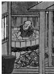
リラックスする男 (部分拡大)

それぞれの風景画は、例えば「和田と言えは『天下の嶮』の和田峠を控えた宿場」というように、各宿場のキャッチフレーズを絵で表しているといわれます。