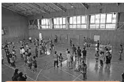
なぎがまCS 西村さんの あいさつ

□小綱作り 7 / 1 (日) 午前9時30分～ 会場：南小学校、北小学校 1,500本作製