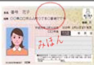
マイナンバーカード ↑こちらのカードが必要です

この通知カードを写真入りのマイナンバーカードに替えることで利用の幅が広がります！