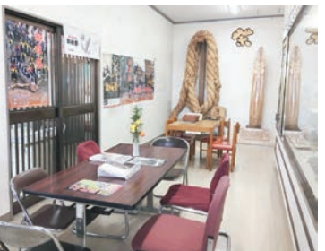
▶「変更後」休憩所に展示物がたくさん