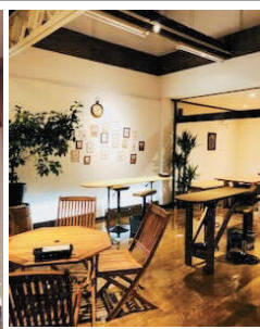
▲広く明るい店内で皆さまをお待ちしております。