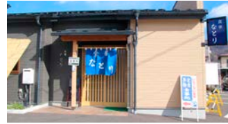
イオン諏訪店向かい側です

特に甘辛しょうゆだれの「たれかつ井」やカラッと揚げた「天ぶら定食」は当店自慢のメニューです。当店自慢の味をぜひお召し上がりください。皆さまのお越しをお待ちしております。