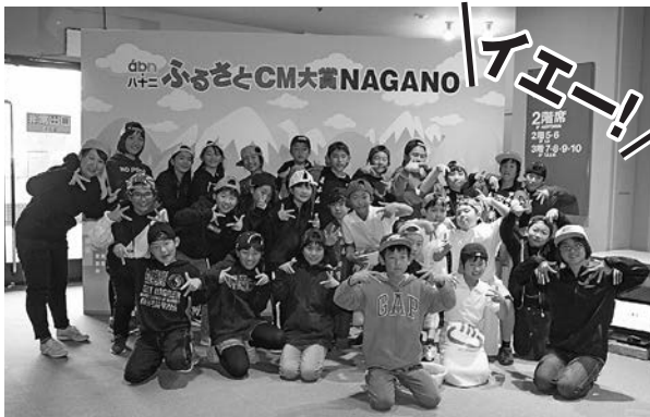
みんなで喜びのラッパーポーズ♪