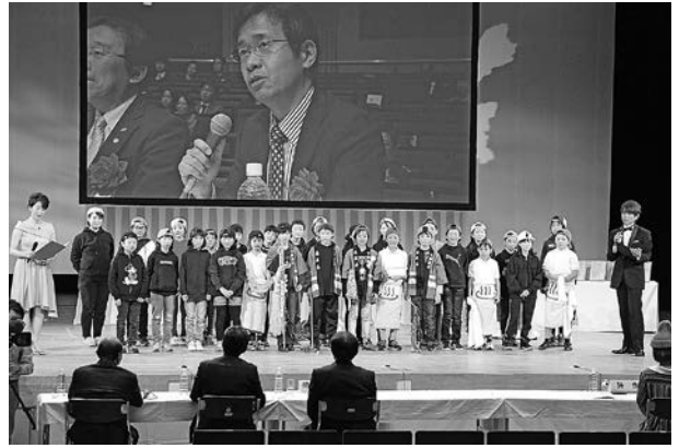
無事アピールを終え審査員から講評をいただいている子どもたち

審査員からは、「小路いっばい」が頭から離れない、非常に良い韻を踏んだ作品韻の踏み方が5年生の作品とは思えない高品質なものに仕上がっている。下諏訪町は小路が昔から有名な地域資源。マーケティングとして地域資源と伝統をいかに現在のものと組み合わせるかということとは非常に重要なこと。小路という地域資源と現代のラップを組み合わせていることが、マーケティングをよくわかっている。ぜひこれからラップで下諏訪町を盛り上げていただきたい。」と講評をいただきました。