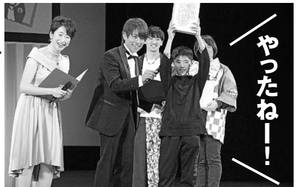
優秀賞受賞の盾をみんなに披露