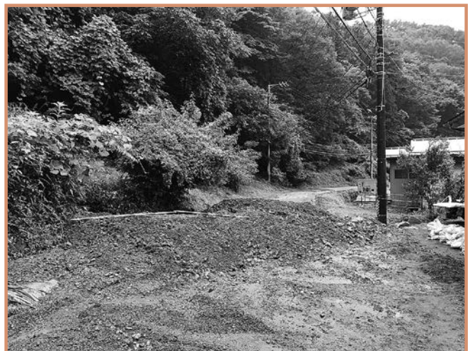
大量の土砂が道路へ流出（東町上）