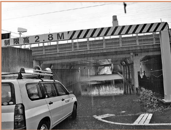
線路下の道路が冠水し一時通行止めに（菅野町）