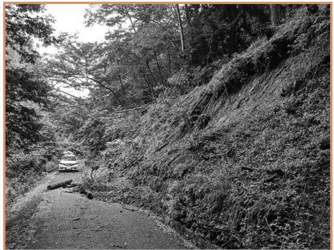
山の法面が崩落し道路へ流出（武居北）