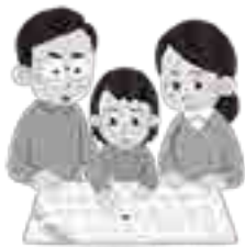
《事前に避難経路の確認》

【想 定】 糸魚川ー静岡構造線断層帯地震による被害／南海トラフ地震による被害／豪雨による被害