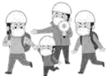
《感染症対策をして避難》