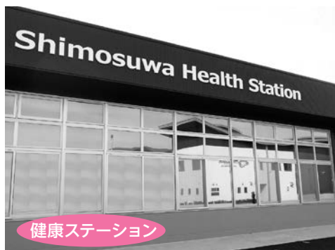
健康ステーション