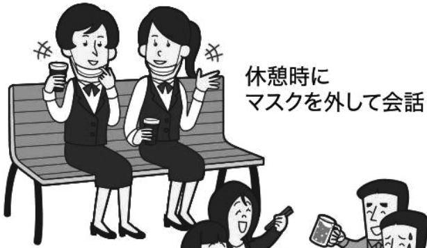
休憩時に マスクを外して会話