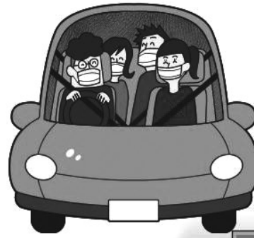
換気をせずに 会話しながら ドライブ