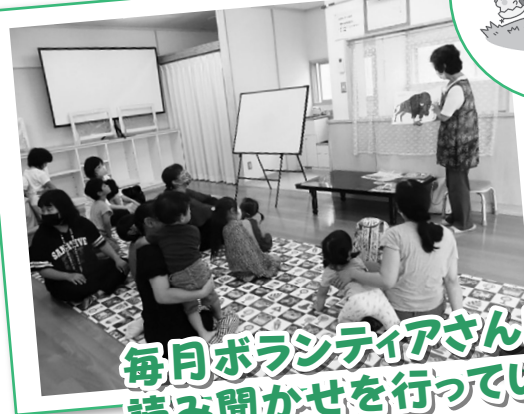
毎月ボランティアさんによる 読み聞かせを行っています。