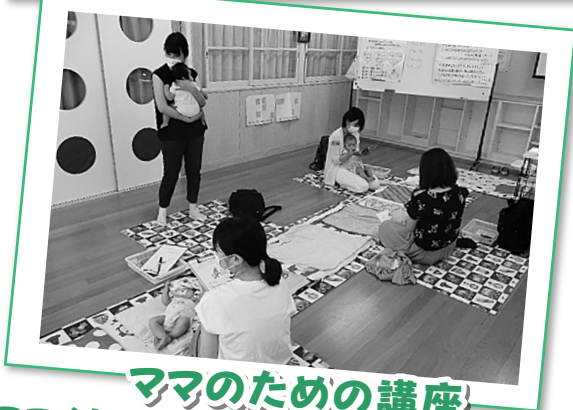
ママのための講座 BP(親子の絆づくり)プログラム