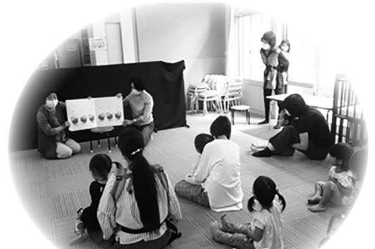
はらぺこあおむしの絵本を見てい ます。図書館のおはなしの部屋の みなさんが来て下さいました。