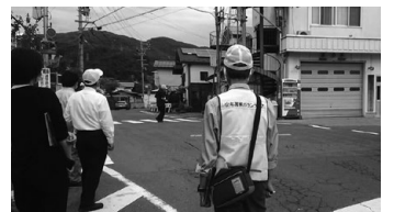
通学路点検の様子 「安全運転にご協力お願いします」

になり、子どもたちの安全 を守ることに なりますの で、ご協力 をよろしく お願い致し ます。