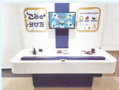
ごみの分別ゲーム