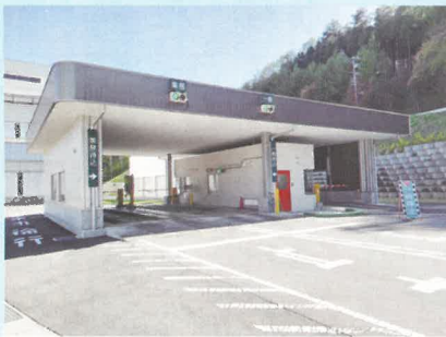
ごみの重さを計る計量棟