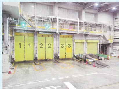
ごみを受け入れるプラットホーム