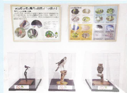
自然環境学習コーナー