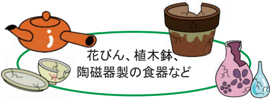
花びん、植木鉢、陶磁器製の食器など