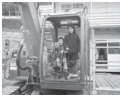
普段乗ることのできない建設機械に乗って記念写真が撮れるよ!!