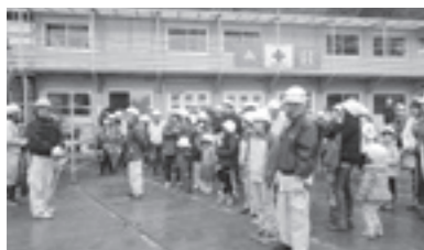
前回の見学会の様子

昨年9月から、建設にとりかかっている諏訪湖周クリーンセンター（ecoポツポ）の第4回目の工事現場見学会を開催いたします。毎回好評の「工事現場見学会」。4回目を迎える今回の現場見学会では、順調に建設も進んでおり、建物の姿、かたちが見えてきた状況をご覧いただけます。普段なかなか身近で見る機会のない工事現場や施設を、是非、体感してください。