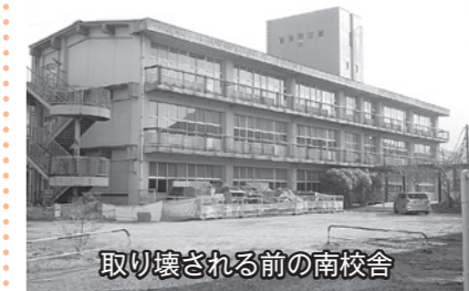
取り壊される前の南校舎