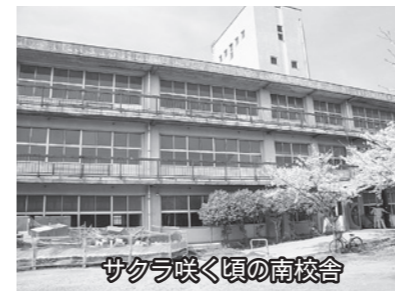
桜が咲く頃の南校舎

「来年、校舎改築が始まります」と言われた時はびっくりしました。5年1組の教室で、みんなと授業をした思い出、大体育館に行く途中や、朝教室に行く途中に友達と話した思い出などが残っていたからです。けれど、42年間の仕事を終えて次の校舎に思いをたくし改築されると、悲しい思いをなくした。南校舎に「今まで楽しい思い出を作らせてくれてありがとう」と心で言った。(市川 智也)